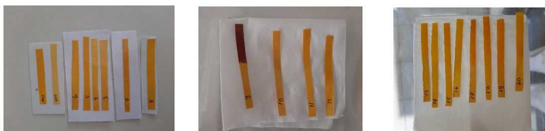
Gambar 2. Hasil Analisis Boraks pada urine dengan metode Kurkumin

Pada penelitian ini dipilih responden dengan kriteria gemar mengonsumsi kerupuk puli setiap harinya dan responden diminta untuk mengisi kuesioner yang di dalamnya berisi pertanyaan berapa keping kerupuk yang dimakan setiap harinya, sehingga akan berguna sebagai pembanding dalam analisis hasil adanya senyawa boraks dalam urine tersebut. Dari hasil penelitian didapatkan 6 sampel positif boraks sedangkan 14 sampel lainnya negatif, sebagaimana Gambar 2 berikut pada kertas kurkumin.